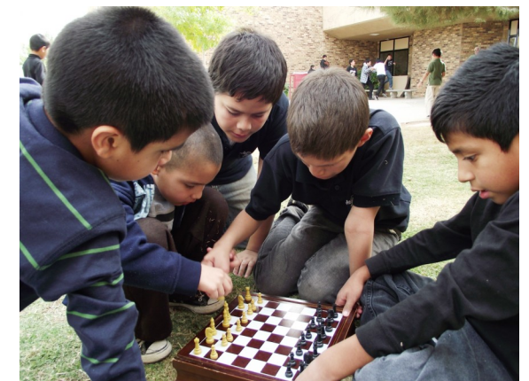
¡Bien hecho equipo de ajedrez!