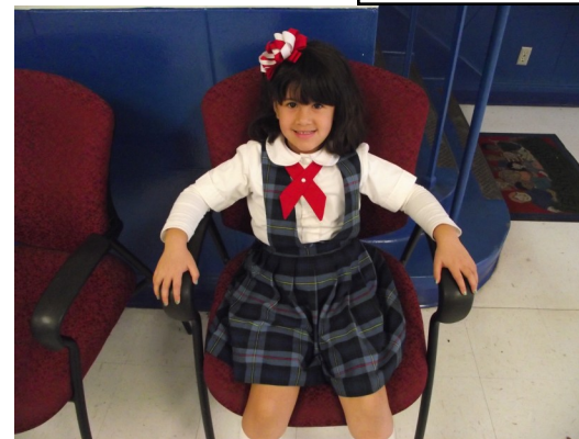
“Compartir y desear lo mejor son muestras de Afecto”

Visitaremos un canal de noticias locales para aprender como se desarrolla el pronóstico del clima.